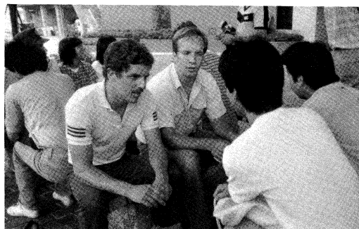
なごやかな談笑風景

彼らとの交流はまだまだ続いた。主な行事としては、学生交歓会、市内観光、少林拳の試合見学、県立劇場での歓迎日本文化祭、県主催レセプション、スポーツデー、専売公社見学などがあった。また、私の友人の所に彼らの1人がホームステイをしていたので、遊びに行ったり、一緒に映画を見に行ったりした。彼らに誘われては、よく踊りにも行った。彼らはとてもタフで、私は学外でも彼らと交流を深めた。離熊の日、彼らは熊本駅のホー