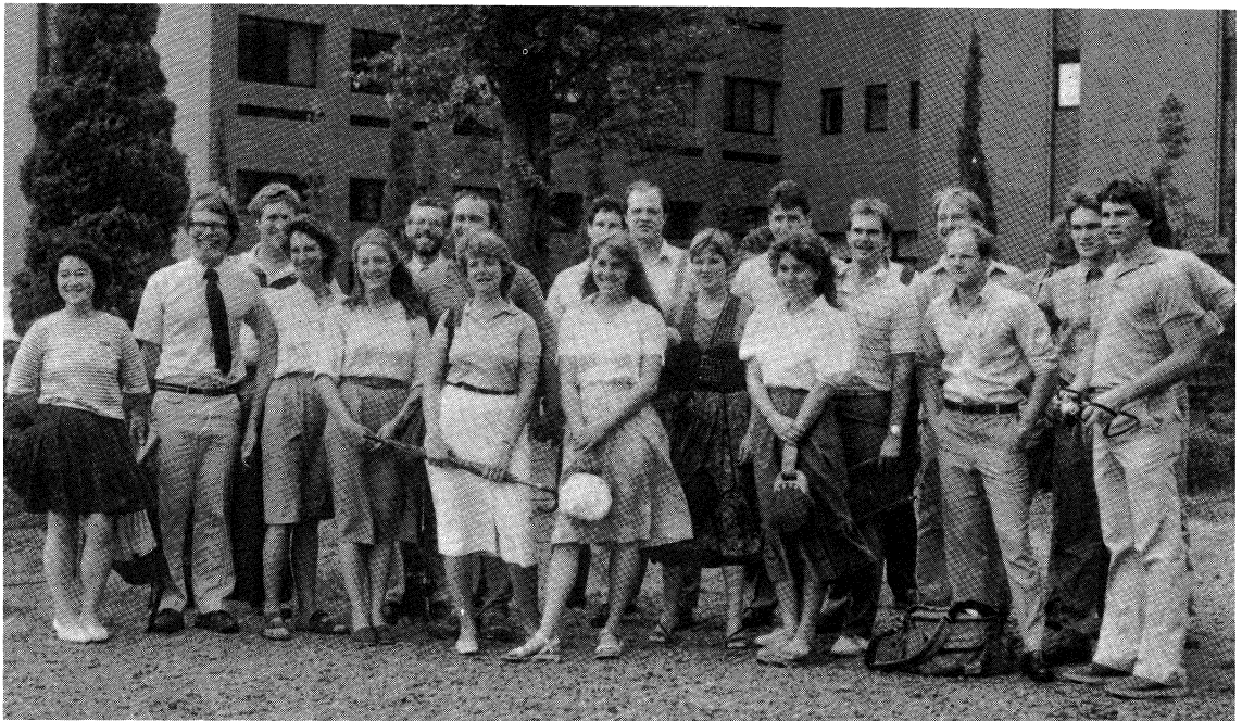
来学したMUS研修視察団の一行