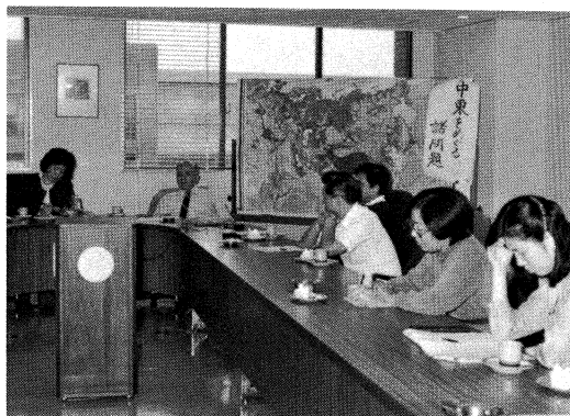
アビール教授を囲んでの研究会

海外事情研究所では、去る9月30日ヘブライ大学(イスラエル)モルデハイ・アビール教授(56才)を迎えて「最近の中東をめぐる諸問題」と題する研究会を開催した。氏は修士論文「アラブ・ナショナリズム研究序説」(1960年ヘブライ大)および博士論文「エチオピア地域における貿易と政治」(1964年ロンドン大)以来、主にアジア・アフリカ・中近東の政治・経済に関する著書・論文を多数発表。今日では、ペルシア湾岸域における石油問題の国際的権威者と目されており、今回は3年前に続いて2度目の来日。研究会は午後4時過ぎより約2時間にわたって質疑応答